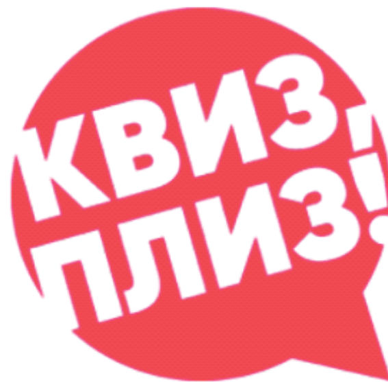
ИГРА КВИЗ ПЛИЗ!