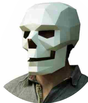
СТАНЦИЯ - ЖЕЛЕЗНЫЙ ЧЕЛОВЕК (полигональные маски)