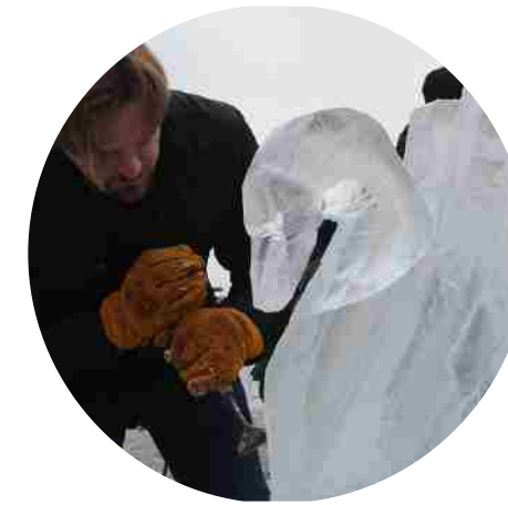
СТАНЦИЯ - ДЕНЬ СУРКА (ледяные фигуры)