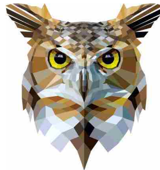
ИГРА «ЧТО? ГДЕ? КОГДА?»