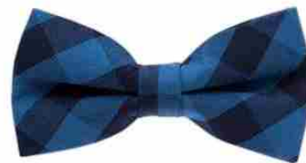
СТАНЦИЯ - JAMES BOND (галстук-бабочка)