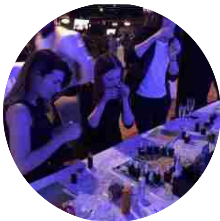
СТАНЦИЯ - ПАРФЮМЕР (парфюмерный мастер класс)