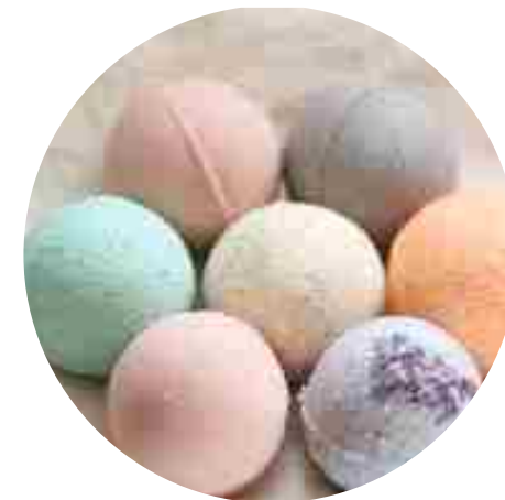
СТАНЦИЯ - АКВАМЕН (бомбочки для ванны)