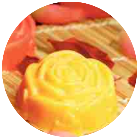
СТАНЦИЯ - БОЙЦОВСКИЙ КЛУБ (мыловарение)